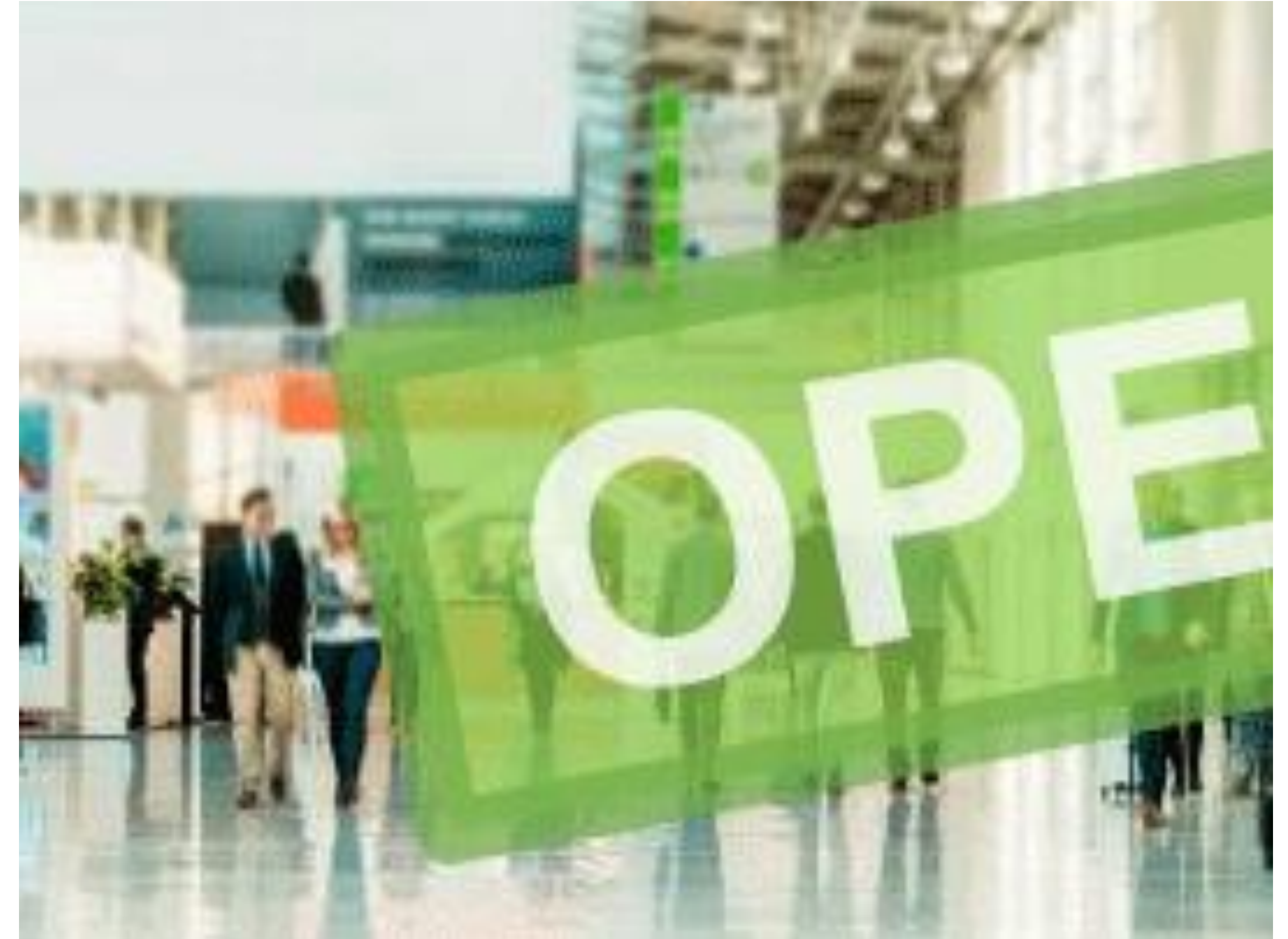
Abbildung_1 Hygienekonzept für Konferenzen. Durchgeführt von einer Projektgruppe von sechs WirtschaftsingenieurInnen, Status: abgeschlossen.

Die Veröffentlichung der Ergebnisse wird angestrebt, aber am besten ist es meist mit den Studierenden und Betreuern der Arbeiten direkt in Kontakt zu treten, um an deren Erfahrungsschatz teilhaben zu können.