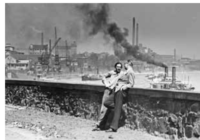
Georg Muche als Lehrer an der Textilingenieurschule vor rheinischer Industriekulisse, 1950er Jahre

Tagung Die Industriekooperationen des Bauhauses – zwischen Innovationswille und Imagewerbung Krefeld 16.–17. November 2018