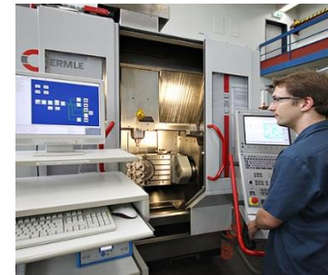
5-Achs-BAZ Hermle C20U