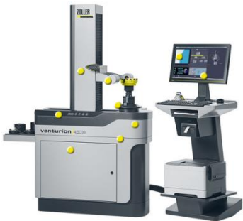
Werkzeugvor- einstellgerät Zoller

Inhalte: 5 Achs-Fräsen in Theorie und Praxis / Werkzeugmanagement / Experiment: Messen der Zerspankräfte beim Fräsen / Fräsen eines eigenen Bauteils / Exkursionen (PwK, Okuma)