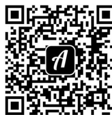
QR-Code zur Rallye

Weitere Fachdatenbanken , die für Ihre Recherche interessant sein können, finden Sie in der DigiBib unter der Rubrik „Datenbanken/Volltexte“ über den Zugang zu Ihrem jeweiligen Fachbereich.