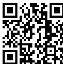
QR-Code zur Rallye

Weitere Fachdatenbanken , die für Ihre Recherche interessant sein können, finden Sie in der DigiBib unter der Rubrik „Datenbanken/Volltexte“ über den Zugang zu Ihrem jeweiligen Fachbereich.